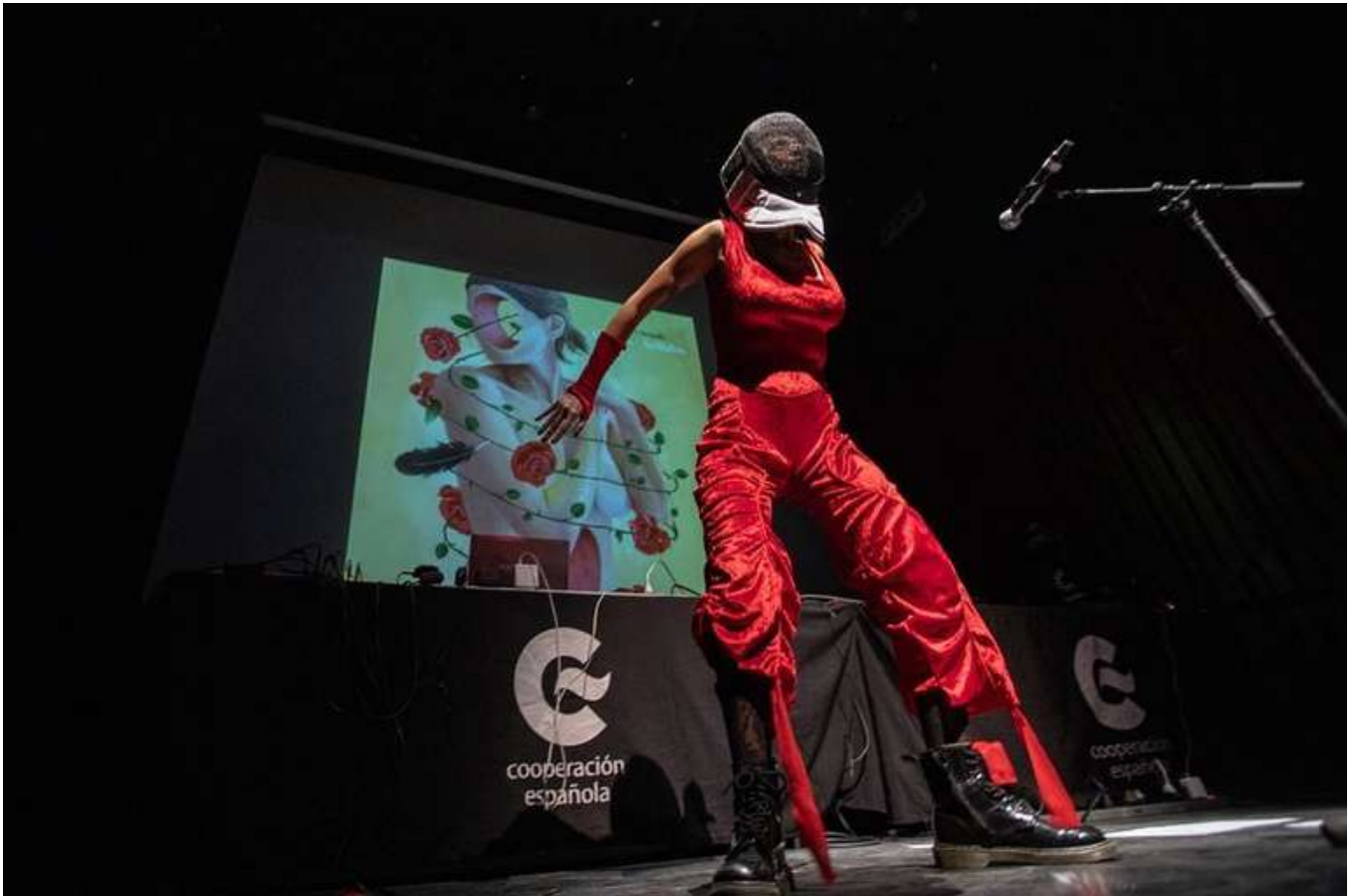
Centro cultural de España en México, Ciudad de México.