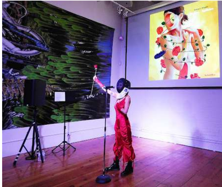
Galería de arte, The howl! Happening, New York