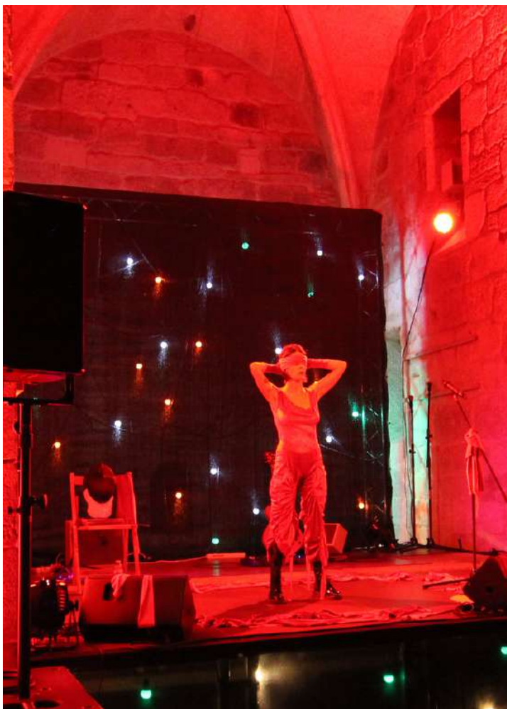
Iglesia de Santa María Magdalena, Ribadavia, Ourense.